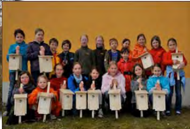
1. April 2011 – Talschule