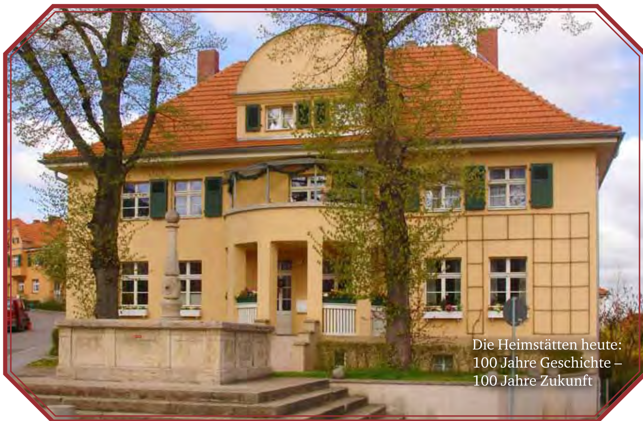
Die Heimstätten heute: 100 Jahre Geschichte – 100 Jahre Zukunft