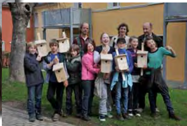
5. April 2011 – Südviertel